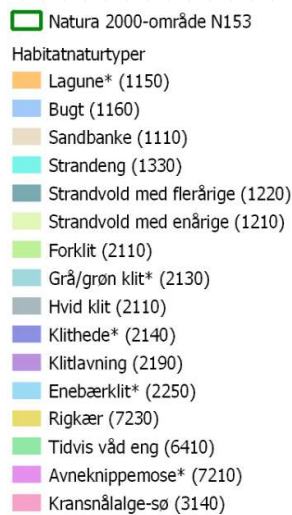
Figur 3.1: Kortlagte habitatnaturtyper i Natura 2000-område N153.

Natura 2000-område nr. 153 består af et habitatområde H134 og et fuglebeskyttelsesområde F102. Områdets samlede areal udgør ca. 4.012 ha, hvor af 97 % er marint. Området dækker det lavvandede havområde mellem Hundested (Halsnæs-halvøen) og Rørvighalvøen, altså overgangsområdet mellem Kattegat og Isefjorden (Naturstyrelsen, 2014), se figur 3.1.